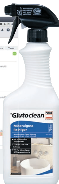
Screenshot: Produktinformations-Übersicht für den Glutoclean Mineralguss-Reiniger

Besonders unentbehrliche Daten wie EU-Biozidverordnung oder -Bauverordnungsnummern, Frostbeständigkeit, Materialform, Rohstoffbasis, pH-Wert, Schüttdichte, etc. sind zu jeder Zeit abrufbar und können für individuelle Zwecke exportiert werden. Sehr wichtig für die Logistik, Verkauf und Gebrauch der Produkte sind auch die Gefahrenstoff-Informationen, die sauber im System angezeigt werden. Spezifische Exportfunktionen ermöglichen die Weitergabe ausgewählter Produktinfos für die unterschiedlichsten Einsatzzwecke.